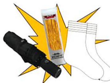
Set comprendente 1 ombrello portatile + 1/2 kg. pasta + 3 paia calze